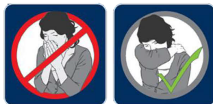
Auf Nieß- und Hustenetiquette achten